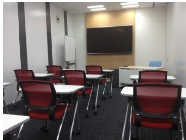
大阪セミナールーム