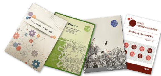
アシスト作成のオリジナルテキスト

アシストでは、技術支援やサポートをお客様に提供して いく中で得た知見やノウハウを体系立て、 実践型の研修 カリキュラムとオリジナルテキスト を作成しています。