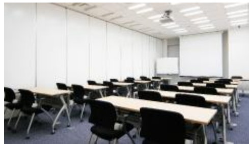
東京（市ヶ谷）セミナールーム